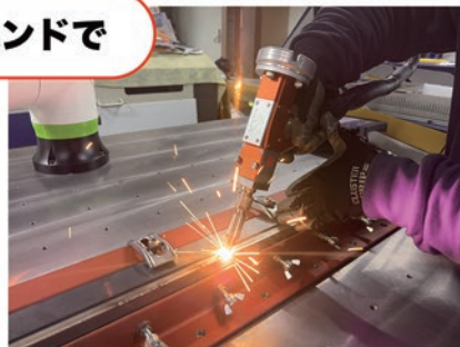
多品種小ロット製品や仮付けなどに