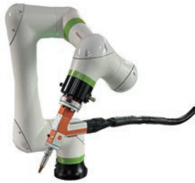
協働ロボット(FANUC製) CRXシリーズ