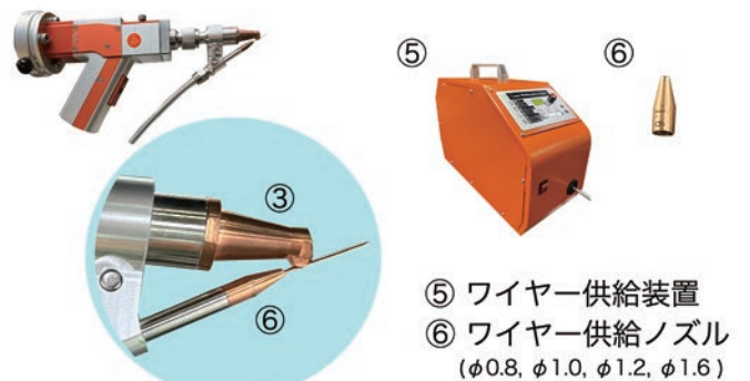
⑤ ワイヤー供給装置 ⑥ ワイヤー供給ノズル (φ0.8, φ1.0, φ1.2, φ1.6)