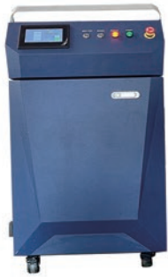
ファイバーレーザー溶接機 E-FIBERシリーズ