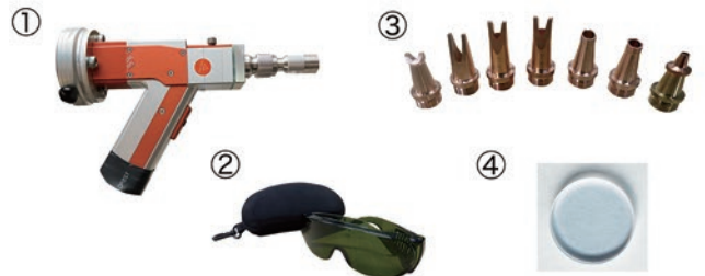
① トーチ ② 保護メガネ ③ ノズル ④ 保護ガラス